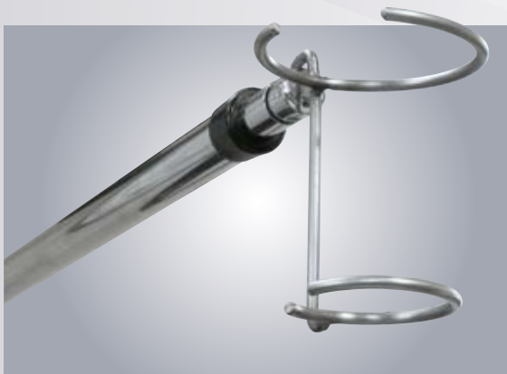
D1 UCHWYT (KOSZYCZEK) DO PŁYNÓW INFUZYJNYCH HOLDER FOR BOTTLED INFUSION FLUIDS

ŚCIENNY Z ZASŁONĄ IV ARM-WALL MOUNTED WITH COURTAIN/SCREEN