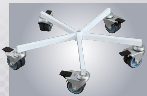
A3 KÓŁKA PODWÓJNE \varnothing 75 mm Z HAMULCEM \varnothing 75 mm RUBBER SWIVEL WHEELS (DOUBLE) WITH LOCKS