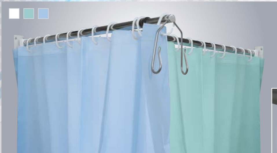
J1, 2, 3 ZASŁONA ZMYWALNA 180x200 cm 180x200 cm CURTAIN/SCREEN WASHABLE