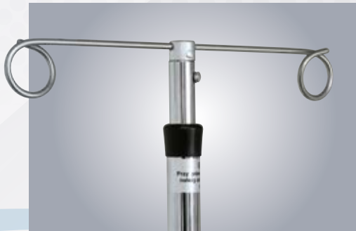
D3 UCHWYT 2-RAMIENNY 2-ARM HOLDER FOR IV INFUSION FLUIDS