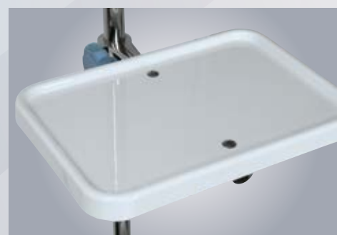
F1 PÓŁKA 28x22 cm TWORZYWOWA 28x22 cm SHELF-POLYMER