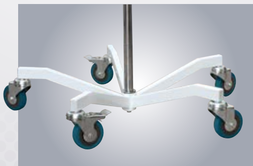
C1/C2 PODSTAWA STATYWU Z OBNIŻONYM ŚRODKIEM CIĘŻKOŚCI STAND BASE WITH LOWERED CENTER OF GRAVITY