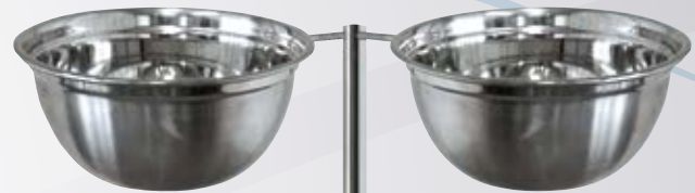
H1 MISA Z UCHWYTEM MONTAŻOWYM DO STOJAKA (DRUGA - OPCJONALNIE) MEDICAL WASTE BOWL WITH MOUNTING BRACKET (OPTIONAL)