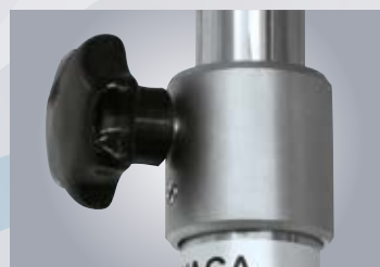
B2 BLOKADA STATYWU EXTENSION LOCK