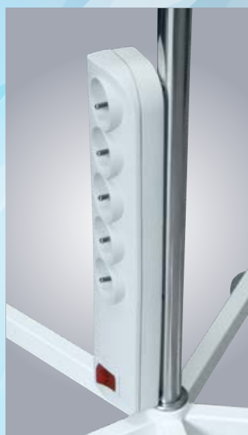
E1/E2 5-GNIAZDOWY PRZEDŁUŻACZ Z WYŁĄCZNIKIEM 5-SOCKET EXTENSION CORD WITH ON/OFF SWITCH