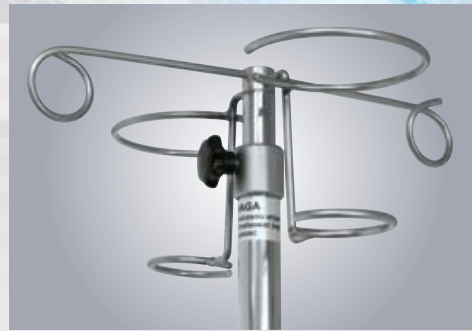
D2 2 UCHWYTY (KOSZYCZKI) DO PŁYNÓW INFUZYJNYCH W BUTELKACH 2 HOLDERS FOR BOTTLED INFUSION FLUIDS